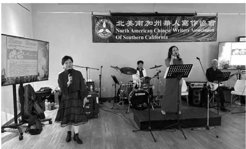
↑歡樂聖誕聚會場卡拉OK。

大家舞得酣熱時，我心中卻還想著，廚房裡還沒切搶來的那好幾隻雞，便臨時加戲，由大家選出『最佳扭臀獎』，結果