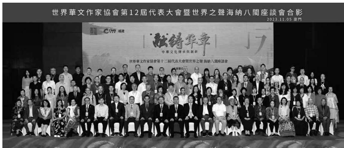
↑出席第十二屆世界華文作家協會廈門年會的代表們大合照。