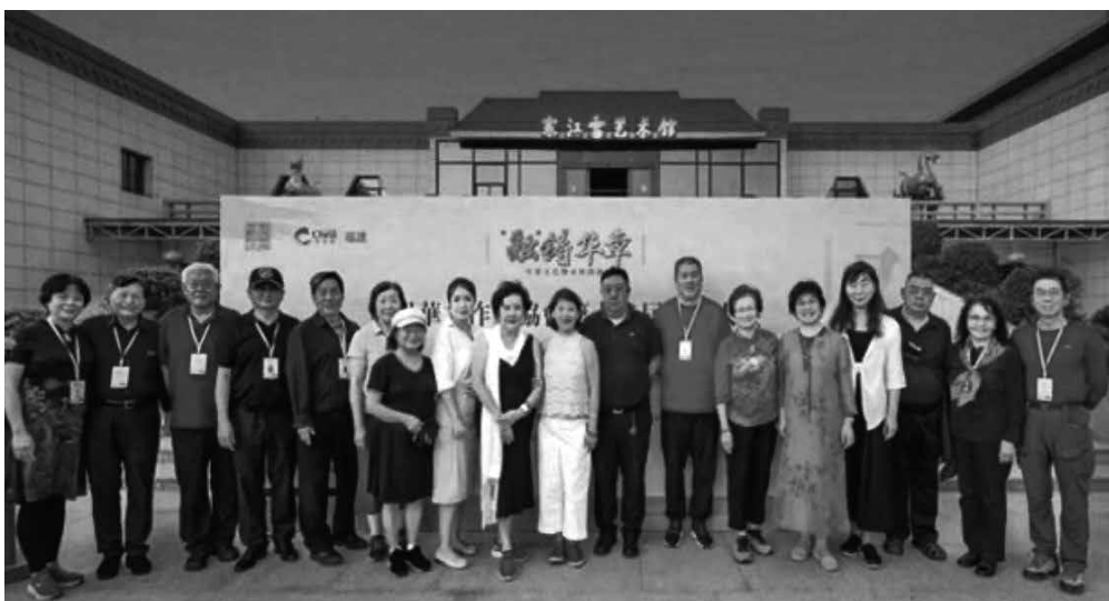
↓出席第十二屆世界華文作家協會年會的北美洲華文作家協會代表們在會場合影。

性，並表示人類命運共同體是要靠文化建起來的，希望各位華文作家、文學愛好者們能夠創作出更多有深度、有溫度、有力量的作品，對浩瀚的中華文學做出更多的貢獻。