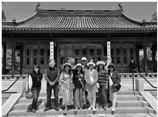
↑ 參加遊漢庭頓園的代表在中國蘇州庭園「流芳園」留影。