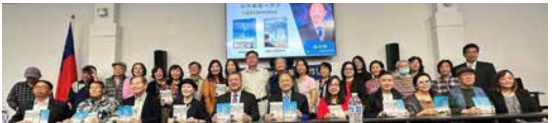
↑參與吳宗錦新書發表會的部分來賓在場合合影。