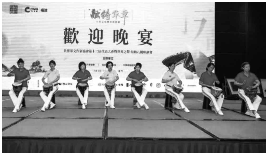
↑第十二屆世界華文作家協會廈門年會歡迎晚宴上的文藝表演。