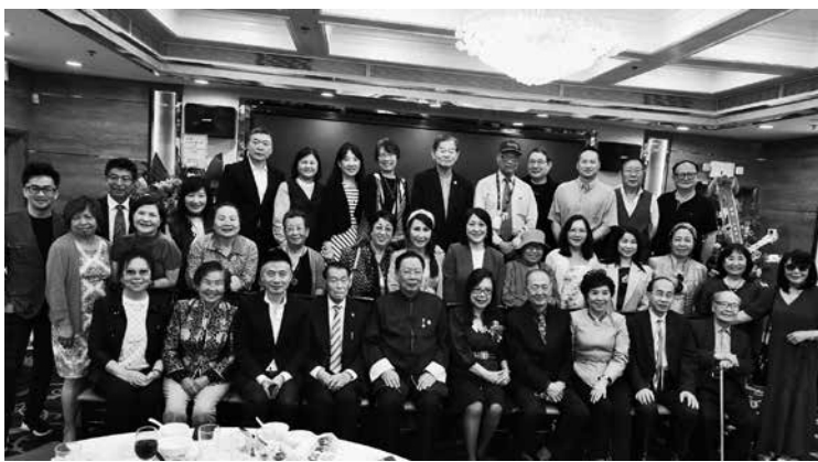
↑ 部分與會嘉賓合影留念。

此次大會由洛城著名雙語主持人、也是北美華文作家協會新一屆副會長彭南林主持。美國國會議員趙美心